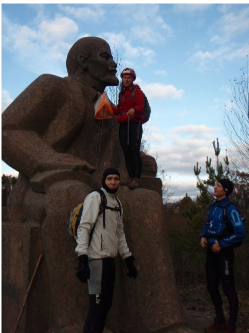
„Leņineklis” Kurzemes mežos starp Īvandi un Gudeniekiem tiek izmantots kā kontrolpunkts piedzīvojumu sacensībās

Šodien var tikai ar grūtībām iztēloties, ka pārdesmit gadus atpakaļ pie Baltijas jūras varēja piekļūt tikai dažās, īpaši norādītās pludmales vietās. Pie jūras iziet bija atļauts tikai dienas gaišajā laikā, un nakts laikā pludmales tika uzartas un izgaismotas ar milzīgiem prožektoriem. Lielie novērošanas torņi vēl dažviet ir saglabājušies kā liecinieki no stingrās robežapsardzes laika. Lai apciemotu piekrastē dzīvojošus radniekus vai draugus, bija nepieciešama speciāla atļauja, kas jāuzrāda kontroles punktos. Dažkārt atļaujas netika izsniegtas vai kontroles punktos netika atzītas. Kolkasraga, kas šķir Baltijas jūru no Rīgas jūras līča, apkārtnes iedzīvotājiem nebija ļauts peldēties Baltijas jūrā, jo pastāvēja drauds, ka tie varētu izlemt peldus šķērsot jūru uz Gotlandes salu, kas atrodas 150 km attālumā. PSRS ārējā robeža bija stratēģisks objekts un nekāda veida lieka uzmanība tai nebija vēlama. Ir skaidrs, ka šajos reģionos attīstība bija stingri ierobežota, tādējādi ļaujot dabai saglabāties neskartai.