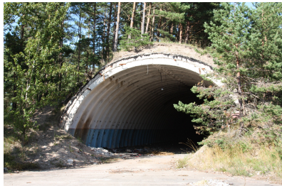
Cirpstenes zenītraķešu bāze

Projekta „Baltijas Zaļā josta” ietvaros Lauku ceļotājs apsekojis 80, dažādu laiku militāros objektus. Nereti Dzelzs priekš kara laikā militārajām vajadzībām izmantotas vēl „cara laika” un I pasaules kara militārās būves, tādēļ apzinātas arī daudzas no tām. Esam izveidojuši datu bāzi ar fotoattēliem un aprakstiem par to, kādām vajadzībām šie slepenie objekti kalpojuši, kādi notikumi tur risinājušies, kā armijas klātbūtne ietekmēja vietējo cilvēku ikdienas dzīvi. Katram objektam ir fotogalerija, tas atzīmēts Google kartē, kur iespējams skatīt tā stratēģisko novietojumu satelītu uzņēmumā. Gandrīz katram ir arī savs stāsts, joks, leģenda, ko stāstījuši aculiecinieki, un kam datu bāzē atvēlēta īpaša sadaļa. Datu bāze pieejama Lauku ceļotāja mājas lapā ikvienam interesentam: